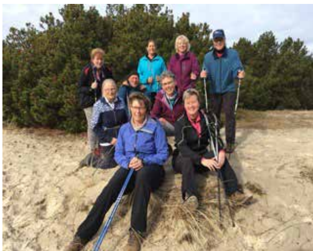
Nordic Wandelgroep van de zaterdagochtend.

Niet iedereen staat op de foto, maar namens de hele groep: Hartelijke groeten, de allerbeste wensen en graag tot ziens in het volgende seizoen.