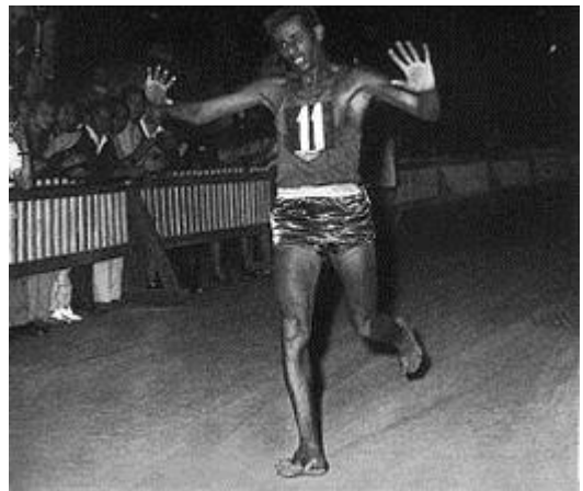
Abebe Bikila wint de marathon op de Os van 1960 in Rome

Zijn sportieve talent ontwikkelde zich, nadat hij een parade had bijgewoond van een stel Ethiopische soldaten in mooie uniformen, die in 1956 hadden deelgenomen aan de Olympische Spelen van Melbourne en de kleren hadden gekregen als beloning. Dat wilde hij ook en hij begon intensiever te trainen, ook buiten werktijd, wat zijn moeder met angst vervulde. Die dacht dat hij zijn lichaam voor altijd kapot zou lopen. Op de nationale militaire kampioenschappen in 1956 brak hij daarna onverwachts de Ethiopische records van Wami Biratu op zowel de 5000 m als de 10.000 m. Met deze indrukwekkende resultaten kwalificeerde hij zich voor de Olympische Zomerspelen 1960 die in Rome werden gehouden.