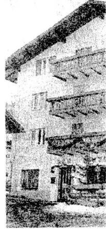
L'albergo Aida di Pe