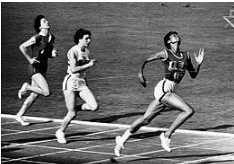
Wilma Rudolph in actie tijdens de OS in Rome, 1960.

12 november 1994 overleed Wilma aan een hersentumor slechts 54 jaar oud