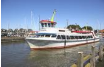
De Marken Express.

Startplaats is Volendam. We lopen over de dijk naar Monnickendam. Hier is de koffie+gebak-stop. We volgen daarna de Zeedijk, bij Uitdam vervuilen we de oude dijk voor de nieuwe (1957) naar Marken. Op het eiland maken we een ronde door het dorp en gaan vervolgens richting de haven. Met de Marken Express varen we in een half uurtje weer terug naar Volendam (kosten boottocht € 6.50)