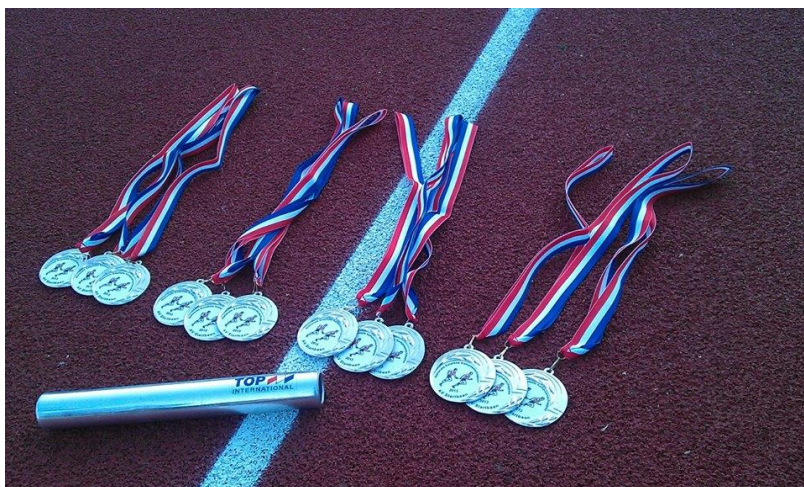
De opbrengst van 1 weekend NK Estafette